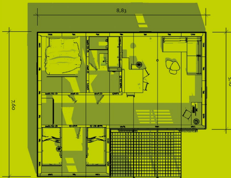
Plans non contractuels

Prix hors transport (chiffré selon destination), hors fondations (étude selon terrain)