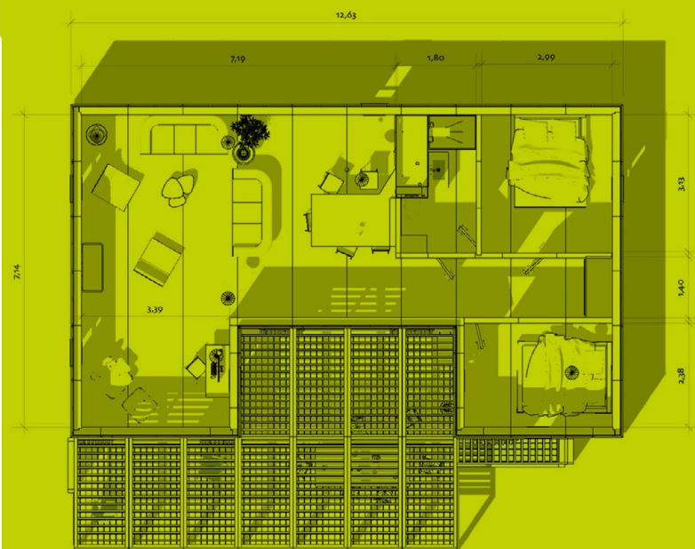
Plans non contractuels

Prix hors transport (chiffré selon destination), hors fondations (étude selon terrain)